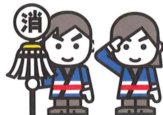
全国消防イメージ キャラクター「消太」