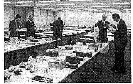
＜昨年度の審査風景＞