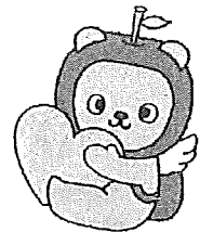
長野県PRキャラクター『アルクマ』 ©長野県アルクマ